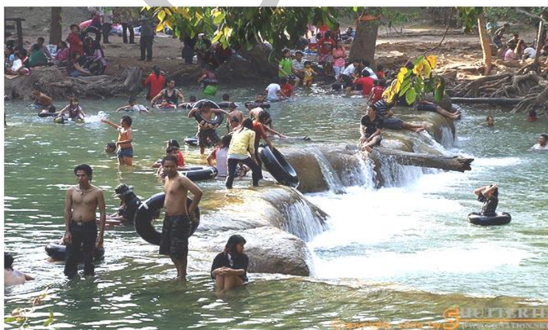
รูปภาพที่ 1 น้ำตกเจ็ดสาวน้อย

อุทยานแห่งชาติน้ำตกเจ็ดสาวน้อยมีพื้นที่ครอบคลุมในท้องที่ อำเภออมกเหล็ก อำเภอมวกเหล็ก จังหวัดสระบุรี และอำเภอปากช่อง จังหวัดนครราชสีมา มีทางเข้าทางเดียวกันกับน้ำตกมวกเหล็ก เป็นทางลาดยางต่อไปอีก 9 กิโลเมตรมีเนื้อที่ประมาณ 29,755 ไร่ โดยอยู่ในเขตจังหวัดสระบุรี 27,210 ไร่ และจังหวัดนครราชสีมา 2,245 ไร่ น้ำตกเจ็ดสาวน้อยเป็นน้ำตกชั้นเดี่ยว มี 7 ชั้น แต่ละชั้นมีความสูงประมาณ 2-5 เมตร ไหลลดหลั่นกันมาตามแนวลำธารเป็นแอ่งน้ำกว้าง บรรยากาศร่มรื่นมีบริเวณสำหรับเล่นน้ำ