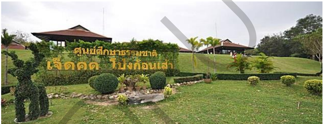
รูปภาพที่ 7 ศูนย์ศึกษาธรรมชาติและท่องเที่ยวเชิงนิเวศเจ็ดคด-โป่งก้อนเส้า

ศูนย์ศึกษาธรรมชาติและท่องเที่ยวเชิงนิเวศเจ็ดคด – โป่งก้อนเส้ามีความอุดมสมบูรณ์ และหลากหลายทางชีวภาพทั้งพันธุ์พืชและสัตว์ป่านานาชนิด มีพื้นที่ติดต่อกับด้านตะวันตกของอุทยานแห่งชาติเขาใหญ่ ประกอบด้วยป่าหลายชนิด ได้แก่ ป่าดิบแล้ง ป่าดงดิบชื้น ป่าเบญจพรรณ และทุ่งหญ้า ก่อให้เกิดความหลากหลายของพันธุ์พืช เป็นต้นกำเนิดของน้ำตกต่าง ๆ ในพื้นที่ พันธุ์ไม้ที่พบมีจำพวกพืชสมุนไพร เช่น พญามิฤทธิ์ ม้ากระทืบโรง กราวเครือ วาน รวมทั้งเห็ดชนิดต่าง ๆ เช่น เห็ดแชมเปญ เห็ดปากหมูฯ สัตว์ป่าที่อาศัยอยู่ในบริเวณ ได้แก่ ช้างป่า กระทิง หมู กวาง เก้ง นางอาย อีเห็น กระงู หมูป่า และ นกอีกประมาณ 158 ชนิด เช่น ไก่ฟ้าหางดก ห้วขวาน กระแตแต้แวด โปรด ขุนแผน ฯลฯ บินข้ามไปมาระหว่างศูนย์ฯ กับเขาใหญ่