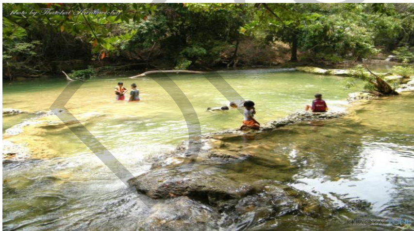
รูปภาพที่ 12 โซนที่ 2 ของน้ำตกดงพญาเย็น

โซนที่ 2 โซนเหนือสะพานซึ่งอยู่อีกฝั่งของสะพานไม้ น้ำไม่ลึกเช่นเดียวกัน เด็กๆ สามารถเล่นน้ำได้ แต่อาจจะลึกบ้างเป็นบางจุด มีหินค่อนข้างเยอะต้องระมัดระวังเวลาเดิน