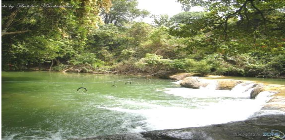
รูปภาพที่ 19 โซนที่ 3 ของน้ำตกคงพญาเย็น