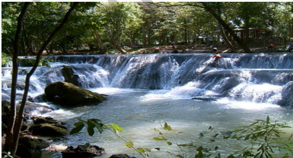
รูปภาพที่ 4 ลักษณะทางธรรมชาติของน้ำตกมวกเหล็ก

สวนรุกขชาติมวกเหล็กและน้ำตกมวกเหล็ก อยู่ห่างจากสระบุรีประมาณ 37 กิโลเมตร ไปตามถนนมิตรภาพ ทางเข้าซ้ายมือตรงข้ามกับร้านขายผลิตภัณฑ์ขององค์การส่งเสริมกิจการโคนมแห่งประเทศไทย (อ.ส.ค.) สวนรุกขชาตินี้มีเนื้อที่ 375 ไร่ ครอบคลุมพื้นที่ระหว่างอำเภอมวกเหล็ก จังหวัดสระบุรี กับอำเภอปากช่อง จังหวัดนครราชสีมา มีลำธารซึ่งมาจากต้นน้ำในอุทยานแห่งชาติเขาใหญ่ ไหลผ่านลงสู่แม่น้ำป่าสัก ซึ่งเป็นเส้นกั้นเขตระหว่างสองจังหวัดดังกล่าว ในลำธารมีแก่งหินลดหลั่นเป็นน้ำตกชั้นเล็ก ๆ บริเวณสองฟากของลำธารมีสะพานแขวน และพันธุ์ไม้ดอกไม้ประดับต่าง