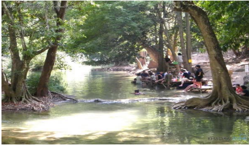
รูปภาพที่ 11 โซนที่ 1 ของน้ำตกดงพญาเย็น